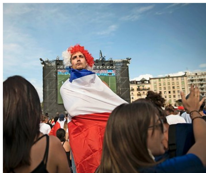
Face aux écrans géants, les supporters de l'équipe de France affichent, à raison, des mines conquérantes. GEORGES CABRERA

«À défaut de briller sur le terrain, l'équipe nationale remplissait nos caisses», résume en souriant un tenancier aux préférences clairement latines. Son équipe à lui est toujours en compétition, il est aux anges. «La Colombie, que l'on n'attendait pas, nous a également apporté du monde», renchérit son voisin de terrasse. Les petites nations font du chiffre à la Foot Arena, animant à leur manière les multiples stands communautaires joliment décorés et pavés. On révisait sa géographie planétaire en balayant du regard les enseignes, en allant d'un avant-bar à l'autre, sans quitter la station debout. Les gens assis ne sont pas majoritaires sur cette