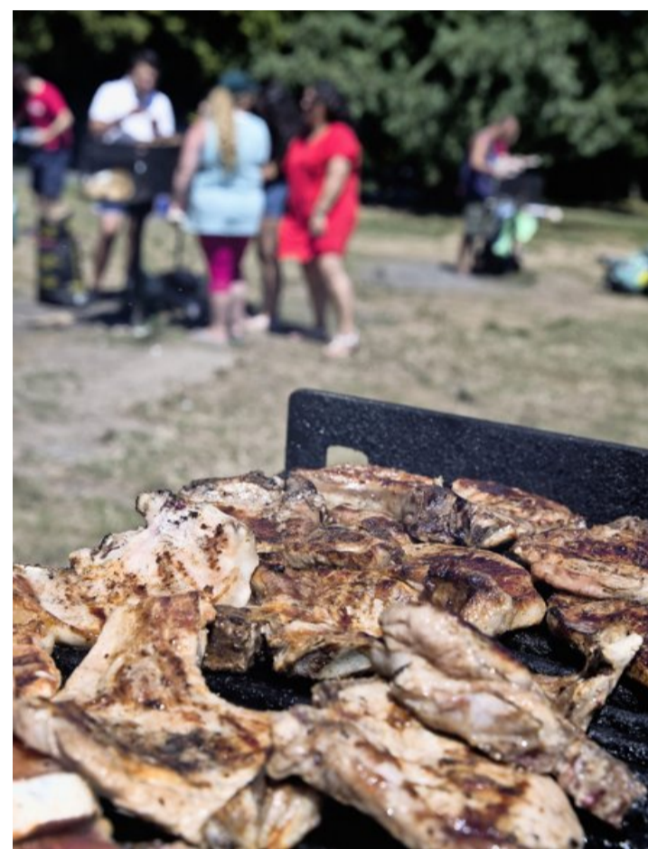
Les grils privés sont interdits et les installations fixes doivent permettre de préserver les pelouses. OLIVIER VOGELSSANG

Comment expliquer, qui plus est, que les nuisances ne soient dénoncées qu'à Champel? Les nez des habitants de la Rive droite seraient-ils moins sensibles? «Sur les autres sites, les grils sont sou-