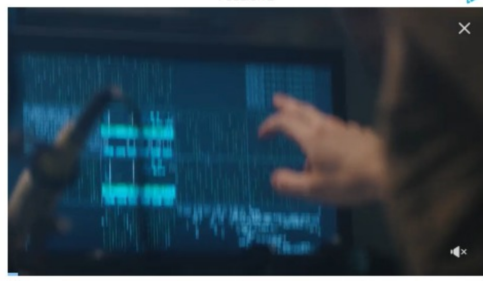
inRead invented by Teads

Delphine a été placée aux EPI par l'assurance invalidité (AI) pour un bilan de compétences afin de déterminer une orientation professionnelle. Depuis la mi-juin, elle fréquente les ateliers du 111 rue de Lyon avec une quinzaine d'autres jeunes, principalement des garçons. Ce mercredi matin, elle est concentrée sur une mosaïque de petites perles.