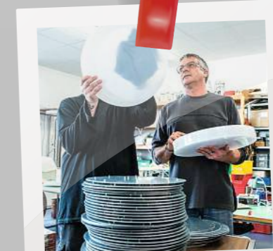
Ateliers BeWeBe, Berne