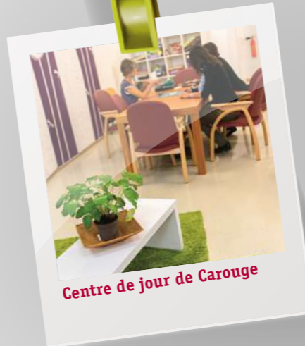
Centre de jour de Carouge

Le centre d'accueil partage les locaux avec le service EPI d'accompagnement à domicile. Un transfert d'informations est ainsi possible lorsqu'un utilisateur des deux prestations traverse une crise. | spy