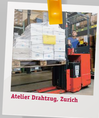
Atelier Drahtzug, Zurich