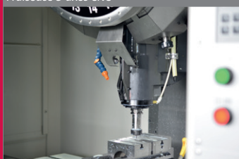
Fraiseuse 3 axes CNC