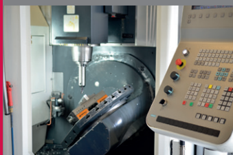
Fraiseuse 5 axes CNC