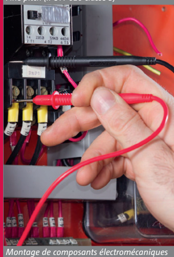
Montage de composants électromécaniques