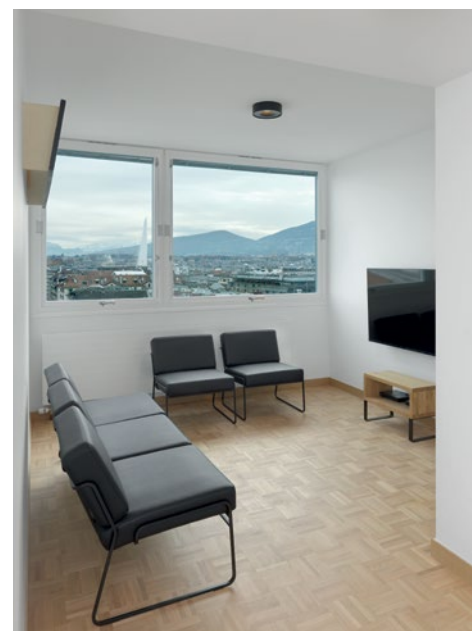
A chaque étage, un espace salon favorise la vie en communauté. Annik Wetter

La bâtisse, signée par Georges Addor, est inscrite à l'inventaire des bâtiments dignes de protection du canton.