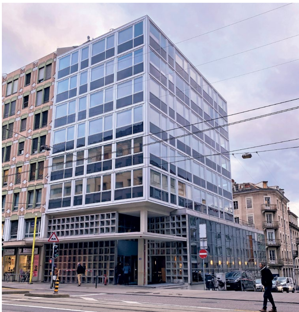
La façade de 1959 rénovée tout en conservant ses traits caractéristiques. EPI

Avec la récente rénovation puis la réouverture de la Maison de l'Ancre, située 34 rue de Lausanne à Genève, y compris son restaurant ouvert au public, les Établissements Publics pour l'Intégration (EPI) montrent le chemin.